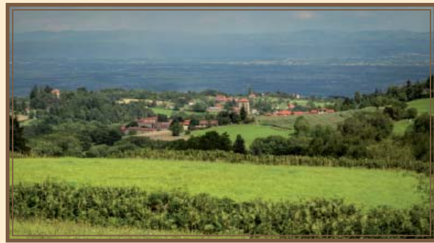
Le village de Verrières en Forez

A votre disposition tout au long de votre séjour :