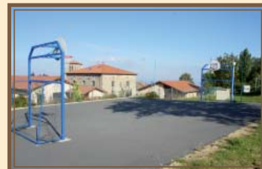
Terrain de basket