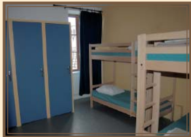
Une des chambres, bâtiment historique