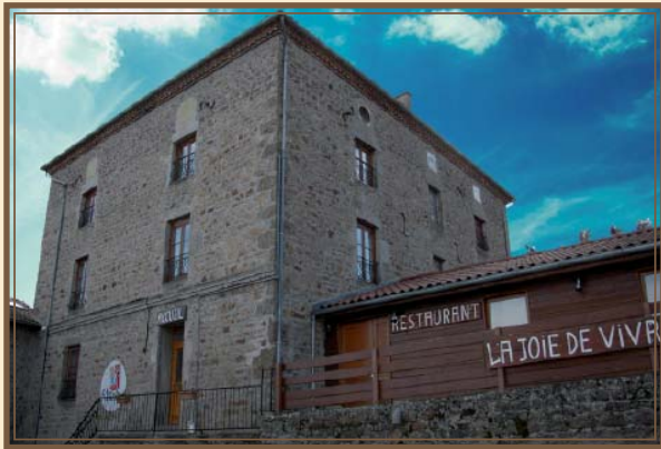
Vue extérieure du centre

A deux pas du bourg du village de Verrières en Forez, le centre de la Joie de Vivre peut accueillir jusqu'à 147 personnes. Proche de Montbrison, le petit village de Verrières en Forez est situé dans ces montagnes foréziennes dites du « soir ».