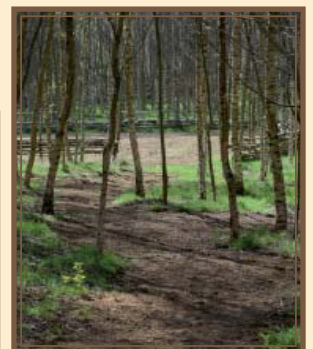
Parc à jeux