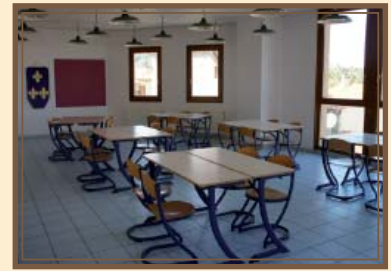
Une salle d'activité modulable